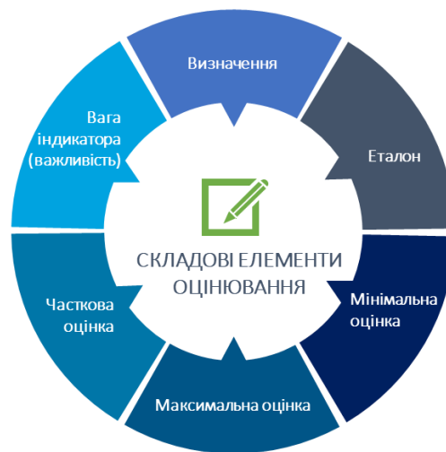
Таблиця 1. Складові елементи оцінювання (детальний опис)

максимальна можлива оцінка в рамках даної методології